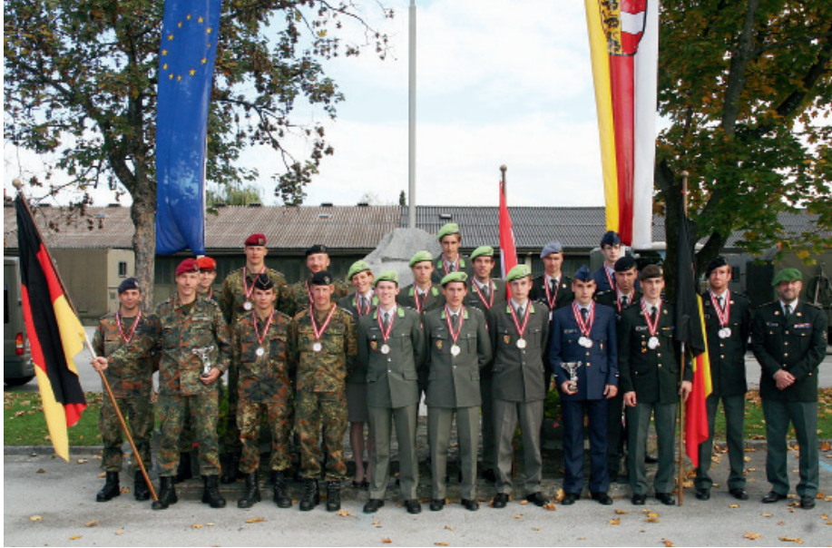
Das siegreiche HLSZ-Team (Mitte) beim regionalen CISM OL-Turnier 2010 in Kärnten Überblick über die Anlage des HLSZ Seebenstein (rechts oben), Kraftkammer (rechts unten)