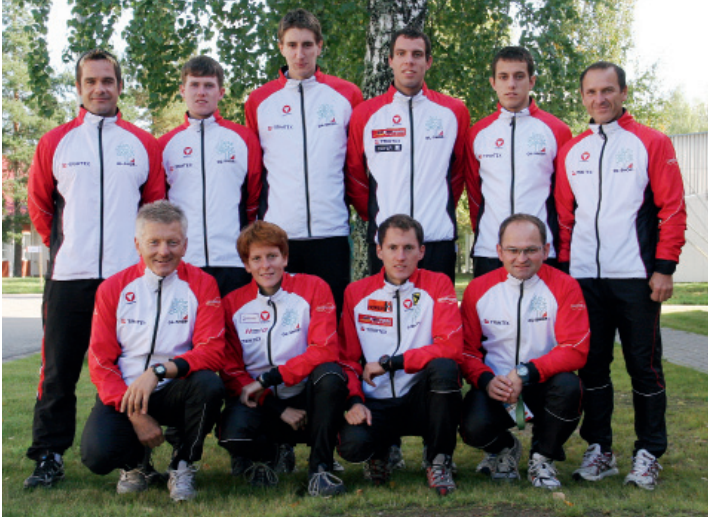
Das österreichische Bundesheer-OL-Team bei der CISM-Weltmeisterschaft 2009 in Estland