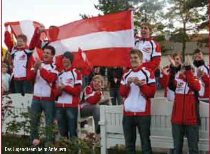
Das Jugendteam beim Anfeuern

tauscht, der Druck überprüft, Luft eindann wieder ausgelassen.