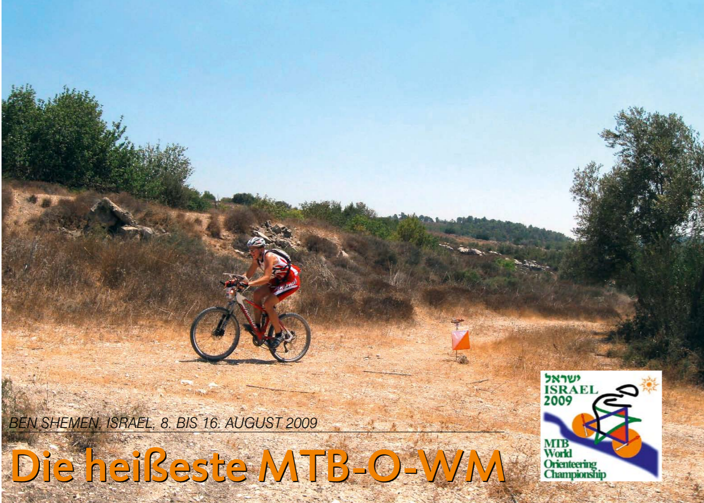
BEN SHEMEN, ISRAEL, 8. BIS 16. AUGUST 2009