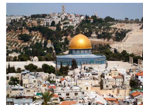
Auch Sightseeing in Jerusalem stand auf dem Programm (Felsendom und Grabeskirche)