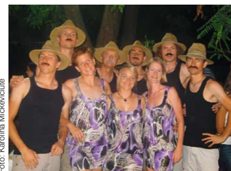
Auch Spaß muss sein!