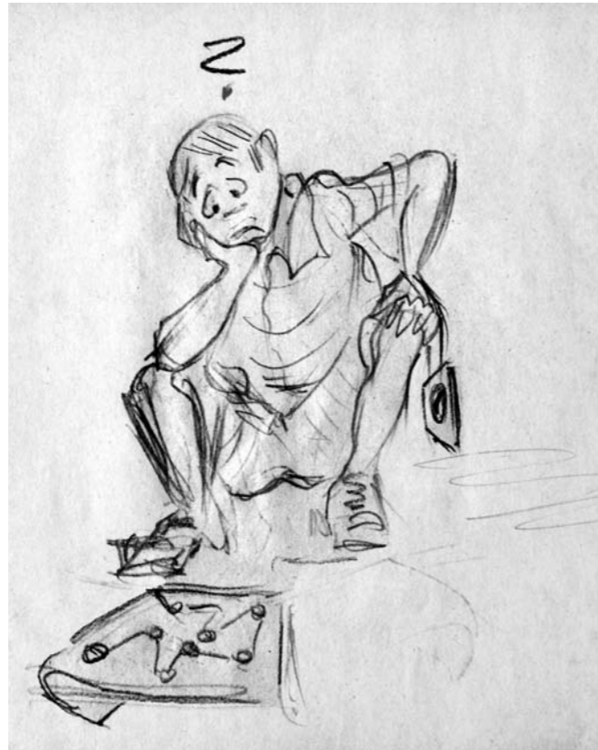
Zeichnung: Hilde Bernaschek

Der Österreichische Fachverband für Orientierungslauf wird gefördert aus Mitteln des