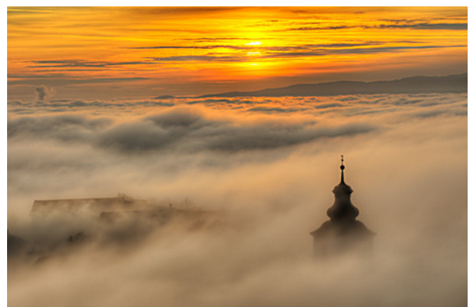
Hochneukirchen im Oktober