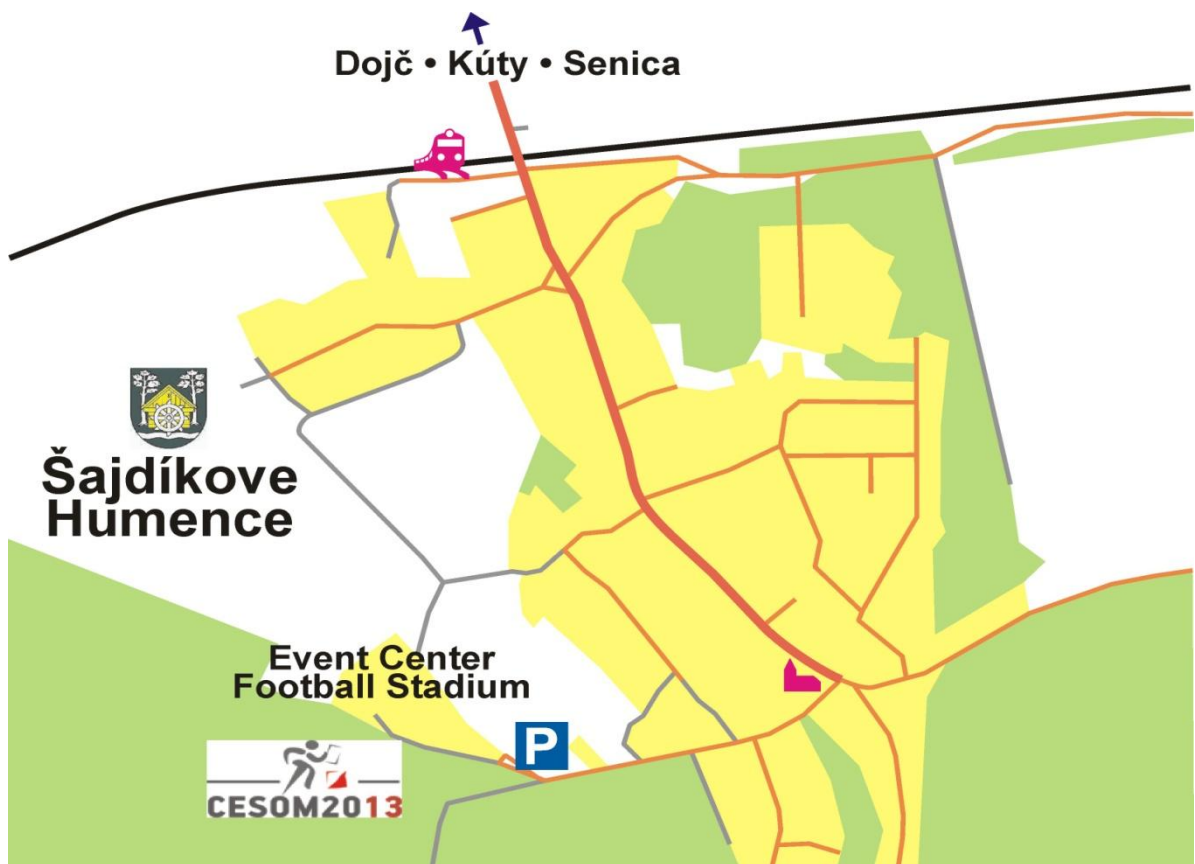
Bild. Nr. 3: Šajdíkové Humence; Illustration der Anfahrt, des Parkplatzes (P) und des Wettkampfszentrums (Event Center, Football Stadium) am 14. 4. 2013