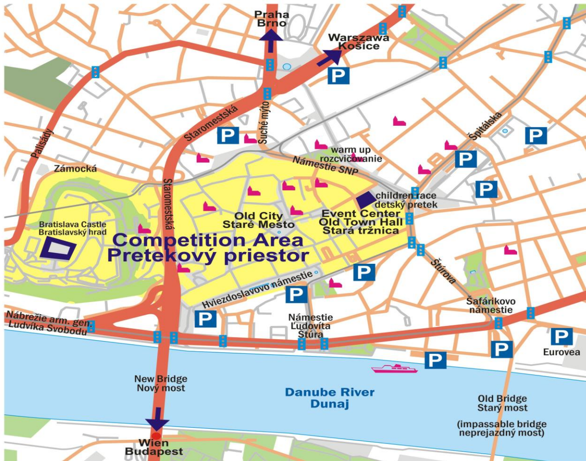
Bild. Nr. 1: Illustration des Kartenausschnittes des Stadtzentrums von Bratislava mit der Markierung der Parkplätze (P), des Wettkampfbereichs (Event Center) und des Gebiets der Kinderstrecke (detský pretek)